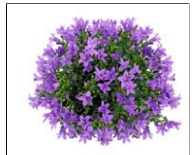
> 40 åbne blomster