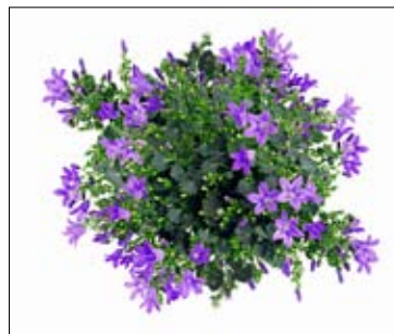
15 - 40 åbne blomster