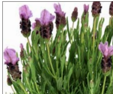
Bella Lavender - Close up