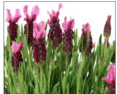
Bella Pink - Close up