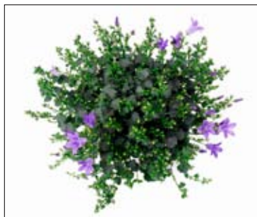
1 - 15 åbne blomster